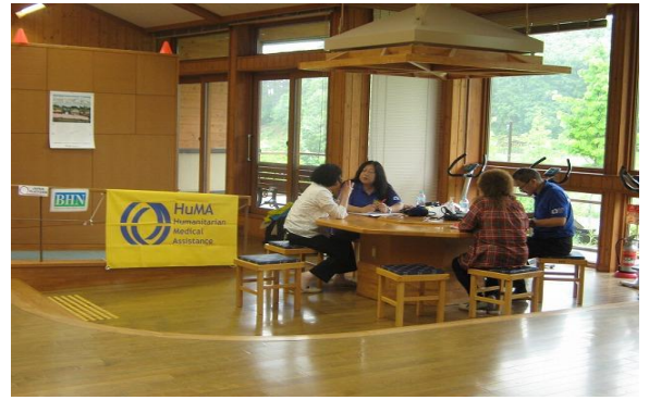
飯舘村いちばん館で相談に乗るHuMA医師、看護師