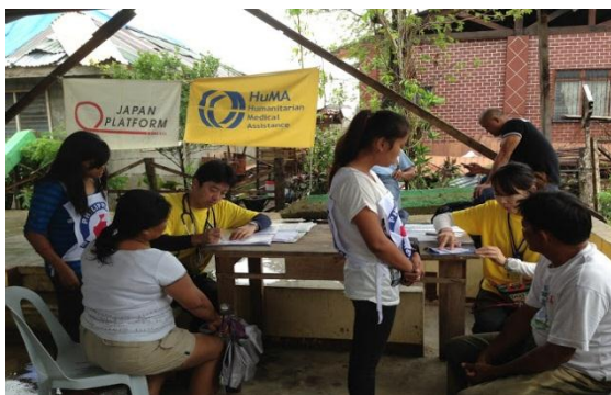
避難所で診療を行うHuMA医師、看護師

また患者数の増加および感染症増加により不足に陥っている医薬品を現地保健省に供与し、また今回の台風被害における医療支援活動の総括を保健省、赤十字、陸軍災害対策本部等に対して行い、被災住民の医療状況を報告することが出来ました。