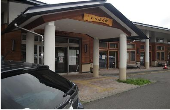
飯舘村いちばん館の正面玄関

HuMAはこの全村見守り隊の方々への医療相談、主に健康相談等実施の要望があり、平成24年6月～10月までの第一期に医師・看護師延べ24名、11月12月の第二期に延べ11名、平成25年1月～3月の第三期に7名を派遣し、村民の健康相談に応えることが出来ました。引続き4月以降も1年間支援活動を継続する予定です。