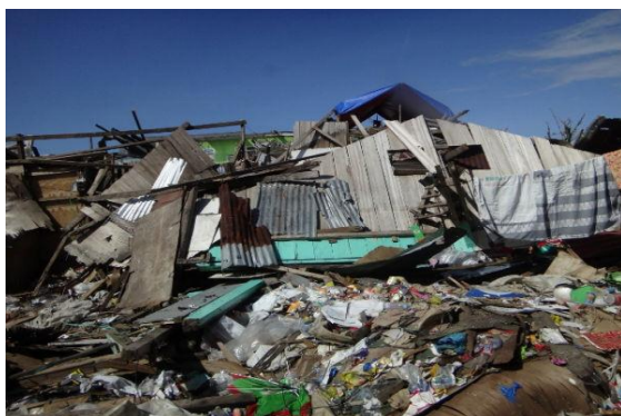
台風の被害を受けたミンダナオ島

従ってHuMAでは初動調査隊を平成24年12月22日から30日まで医師1名、看護師1名、調整員1名の3名を現地コンポステラ・バレー州周辺に派遣しました。そして今後の医療支援活動のニーズ調査、また現地での医療活動の状況等を調査し、次期本隊医療支援活動が必要であるとの判断となりました。