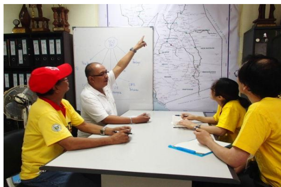
被害の状況を確認する初動調査チーム