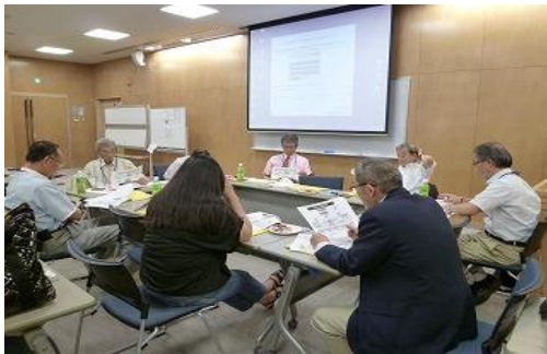
理事会での討議の様子

平成22年度の事業報告、収支報告、平成23年度の事業計画、予算案等が了承され、今回は災害医療に関する国内研修として東日本大震災メディカルスタディを8月に実施することになり、現在復興の真っ最中でもあり、物見遊山的なものにならないよう出席の理事からの指摘がありました。