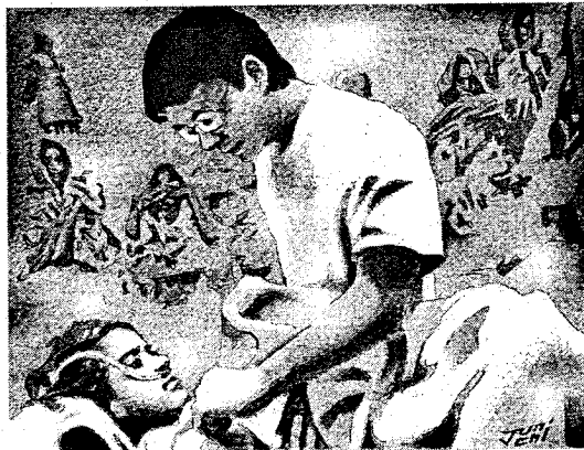
日本のNGOはイラクなどで活発な支援活動を続けている。イラスト:よしおか じゅんいち

若者が支援を続けている。NGOが企業、外務省と作った人道支援システム「ジャパン・プラットフォーム」を利用してNGOが活発な活動を展開したのだ。援助総額が十七億円で、日本のNGO史上に残る画期的な活動で、例えば、ヒースウィンズ・ジャパンはイラク北部で欧米のNGOをしのぎ医療支援を行っているし、災害人道医療支援会(HuMA)を核にした医療チームは、ノヘルバ和實愛護団体の環境なき医師団(MSFE)に伍して難民を援助した。今もJENESB団体が現地で活動中だ。一部の団体の車両が銃撃を受けたこともあって、日本人スタッフは隣国ヨルダンから指示を出し、イラク人スタッフ